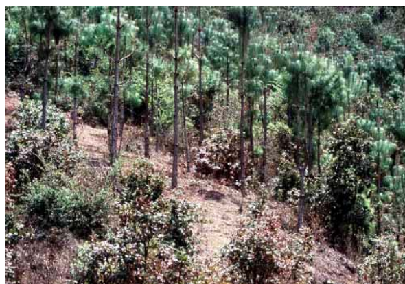
Projecto de Repovoamento florestal em Chiapas, México

O Fórum é o componente-chave do acordo internacional sobre florestas, destinado a incentivar a boa gestão, a conservação e o desenvolvimento sustentável de todos os tipos de florestas e reforçar o compromisso político a longo prazo. Quem desejar acompanhar os trabalhos do fórum, poderá consultar o site http://www.un.org/esa/forests/index.html .