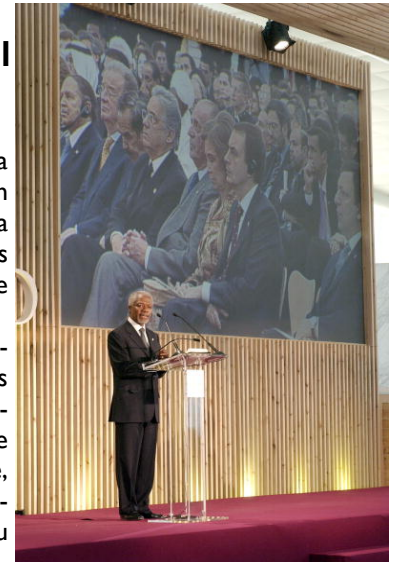
Secretário-Geral na Sessão de Encerramento da Cimeira Internacional sobre Democracia, Terrorismo e Segurança, no dia 11 de Março em Madrid